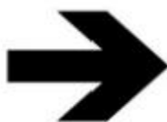
ZAKRĘT W PRAWO