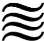
PRZEJAZD PRZEZ WODĘ