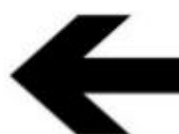
ZAKRĘT W LEWO